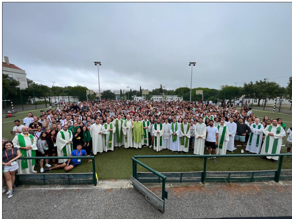
Mons. Salvador Cristau amb els joves de la diòcesi a Alcabideche (Portugal), amb motiu de la participació a la Jornada Mundial de la Joventut a Lisboa.